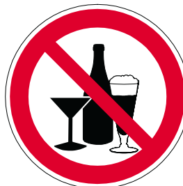
Genuss von Alkohol verboten