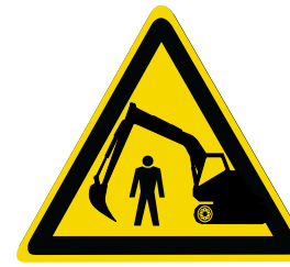
Warnung vor bewegten Baumaschinen