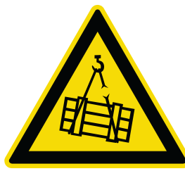
Warnung vor schwebender Last