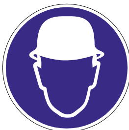
Schutzhelm benutzen bei Gefährdung durch herabfallende oder umfallende Gegenstände