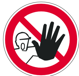
Zutritt für Unbefugte verboten