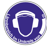
Gehörschutz im Lärmbereich benutzen