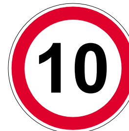
Zulässige Höchstgeschwindigkeit: 10 km/h