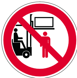
Aufenthalt unter der Last verboten