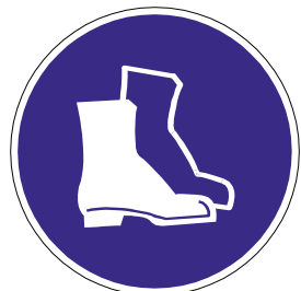
Sicherheitsschuhe benutzen mindestens Schutzkategorie S3 (nach DIN EN 345)